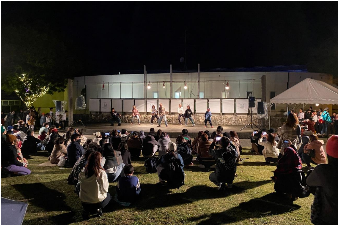
株式会社アグリジャパン ステージイベント担当者：森川 貴文